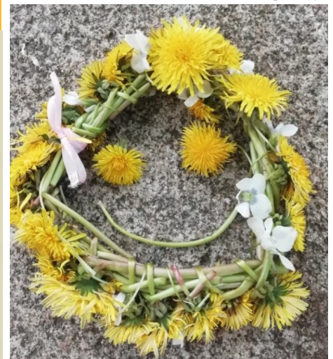
Evos (8d) piešinys 2c kl. mok. darbelis