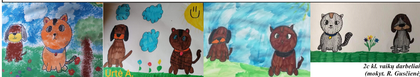
2c kl. vaikų darbeliai (mokyt. R. Gusčienė)