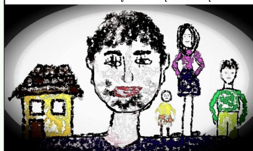
Kamilės Mišeikytės (2a kl.) piešinys