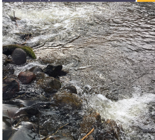
Ramintos (8d) nuotr., Skaistės (8d) piešinys