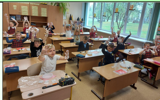
Eksperimentuoja mažieji mokslininkai