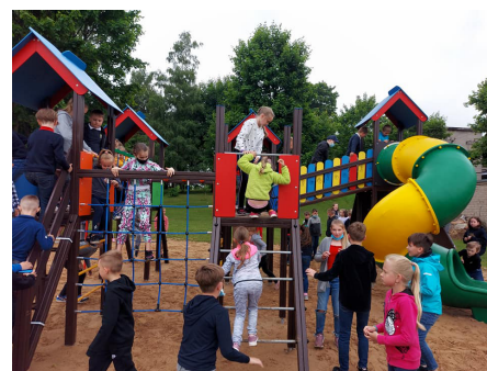
Atidaryta vaikų žaidimų aikštelė