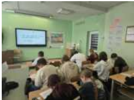
Dailyraščio rašymas žemaičių kalba