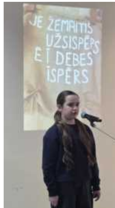
Žemaičių kalbai skirtas renginys „Je žemaitis osėpėrs, ėr i debesi ėspėrs“