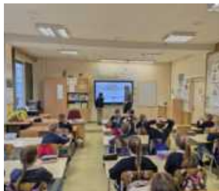
Vasario 27 dieną 4b klasės mokiniai buvo supažindinti su sveiko ir saugaus žmogaus samprata