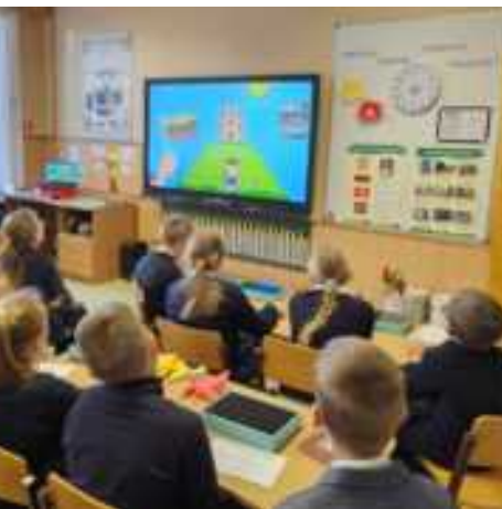
Vasario 12 d. 3b ir 3c klasių mokiniai Lietuvos valstybės atkūrimo dieną paminėjo kartu su VšĮ Pranciškonų gimnazijos trečiokais bendroje nuotolinėje pamokoje „Dovana Lietuvai“