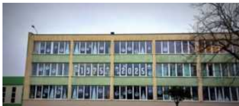
Ruošiamiesi sutikti jubiliejinus 2025-uosius metus, mokyklos langus puošė visi 5-10 klasių mokiniai