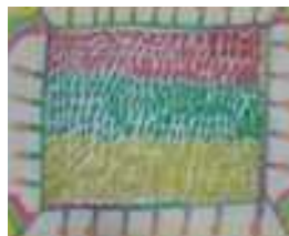
Nojus Balsys, 2c kl.