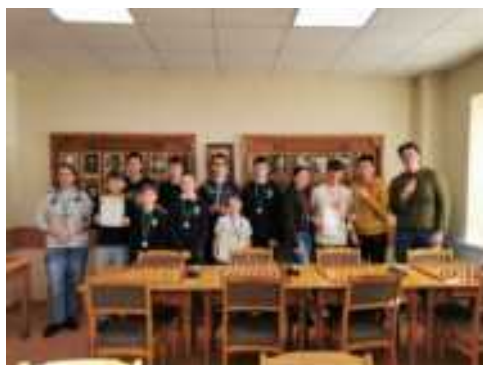
Šachmatų varžybose užimta 2-oji vieta