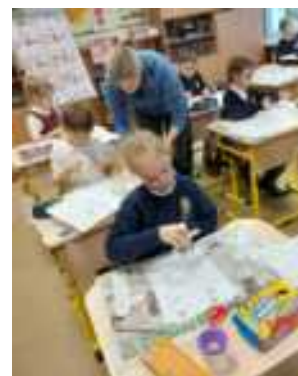
Sausio mėnesį Senamiesčio mokyklos visuomenės sveikatos specialistė kvietė pirmųjų klasių mokinius tapti „Bakterijų trandytojais“