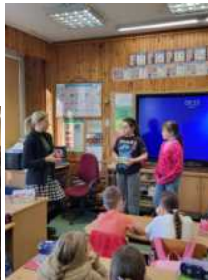
Vasario mėnesį Senamiesčio mokyklos antrokai tapo „emocijų detektyvais“. Kartu su mokyklos visuomenės sveikatos priežiūros specialiste aiškino, kodėl vaikams būtina išmokti atskirti ir suprasti kylančias emocijas ir jausmus