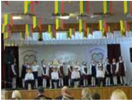
Vasario 6 dieną 2b klasės mokiniai vyko į Plungės specialiojo ugdymo centrą, kur dalyvavo respublikiniame festivalyje - parodoje „Nešuos Lietuvos savo širdyje 2025“