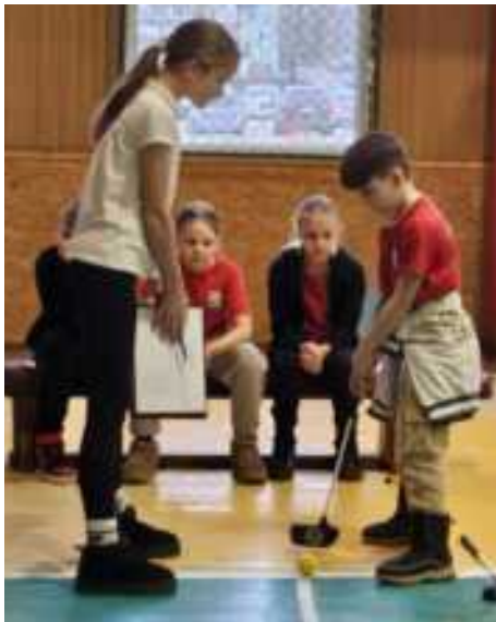
Trečiokai - trečiokams. Pažintis su mažuoju golfu