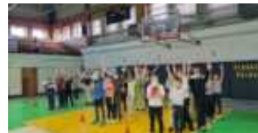
Ketvirtokai – ketvirtokams. Draugiškos estafetėjų varžytuvės