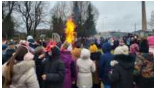
Skaitmeninis konkursas „Užgavėnių dvasia kvietime“