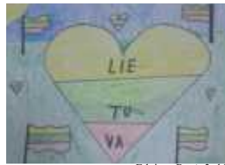
Edvinas Rūtė, 2c kl.