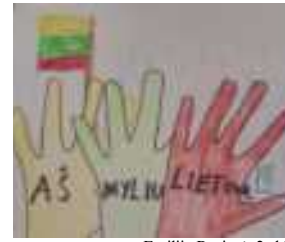
Emilija Pociūtė, 2c kl.