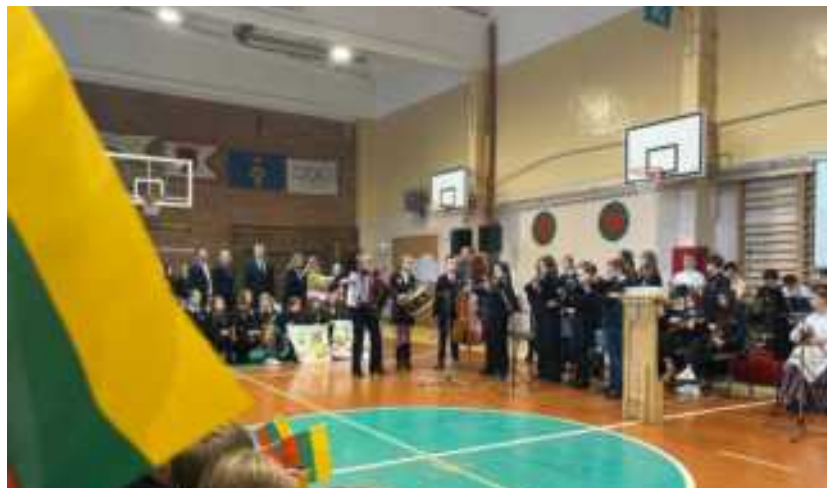
Akimirkos iš renginio

Kiekvienas stengėsi dainuoti iš širdies, jausdamas gilų ryšį su savo šalimi ir skirdamas brangiausias žodžius Lietuvai. Tai buvo ne tik gražios melodijos ir žodžiai, bet ir nuoširdūs jausmai, kurie buvo perteikti per kiekvieną dainą. Šis renginys suvienijo visus dalyvius ir leido jiems pajusti stiprų bendrystės ir pasididžiavimo jausmą.