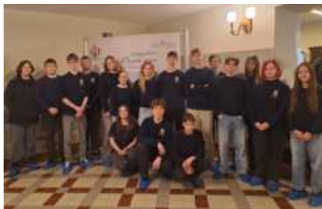
Vasario 13 d. 9b klasės mokiniams buvo vesta netradicinė istorijos pamoka Plungės Žemaičių dailės muziejuje