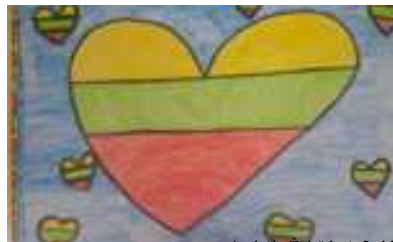
Andrėja Zvirždytė, 2c kl.