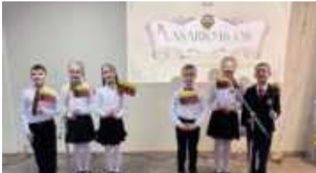
Pradinių klasių mokiniai ir mokytojai gieda Lietuvos himną

Nuo vasario 10 iki 13 dienos, pradinių klasių mokiniai savo žinias pasitikrino viktorinoje „Pažink Lietuvą“. Jos tikslas - skatinti mokinius geriau pažinti Lietuvą, jos istoriją, kultūrą, geografiją ir svarbiausius simbolius. O vasario 14 dieną mokiniai deklamavo eiles, kartu su mokytojais giedojo Lietuvos himną ir kalbėjo apie istorijos svarbą.