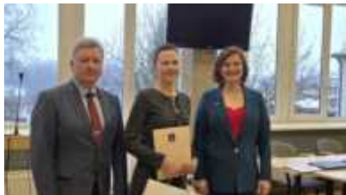
Padėka Senamiesčio mokyklai už kalėdinį mokyklos papuošimą