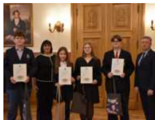
Žemaitiško rašto dailyraščio konkurso laureatai