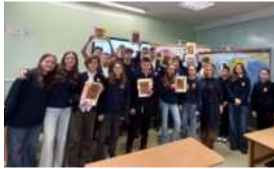
Integruota istorijos ir dailės pamoka „Jeį puodynės šukė prabiltų“