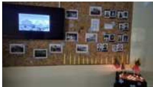
Sausio 13-oji Senamiesčio mokykloje