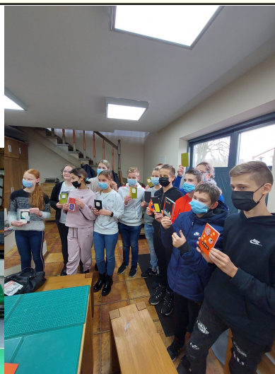
7c kl. mokiniai Bitėnuose