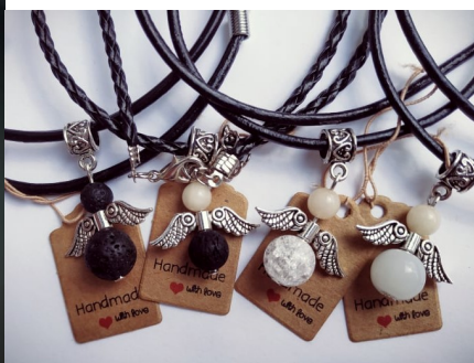
Justės kurti papuošalai