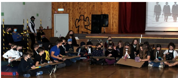
Akimirka iš penktokų „krikštytųjų“