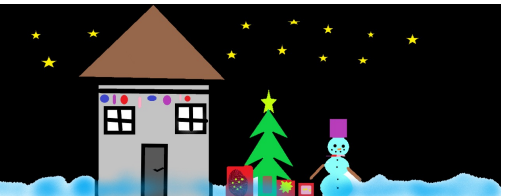
Deimantės Kaniavaitės, 3a kl.