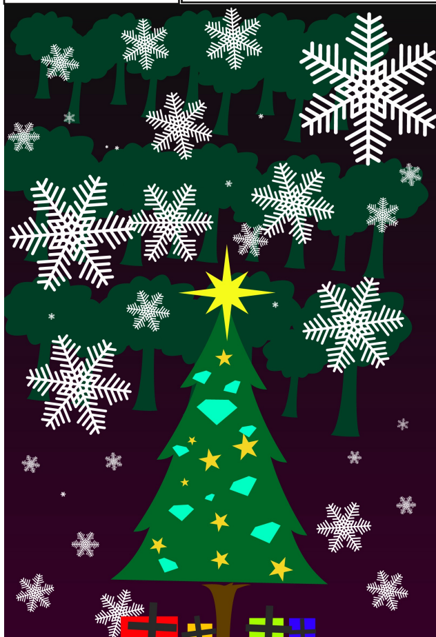
Liepos Rimkutės, 3a kl.