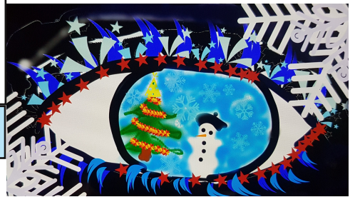
Kamilės Mišeikytės, 3a kl.