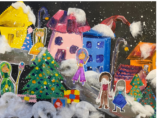
Kamilės Mišeikytės, 3a kl.